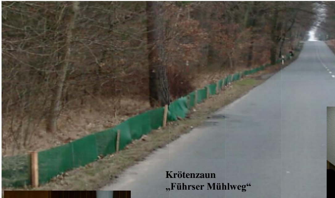
Krötenzaun „Führser Mühlweg“